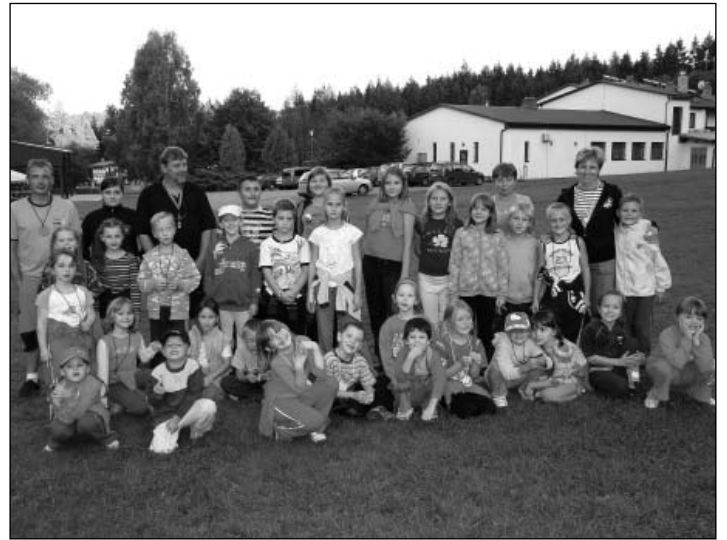
Víkendový tábor na Nové Louce se vydařil

A ještě jedna pozitivní zpráva. V novém školním roce šlo poprvé do školy v Albrechticích 13 prvňáčků a lze si jen přát, aby tento trend pokračoval i v následujících letech. Radi jsme přikoupili nové lavice a židle a přestavěli jednotlivé třídy. Přeji všem dětem, i těm starším, aby se jim ve škole líbilo a chodily do ní rády.